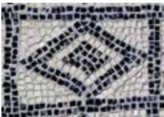
Rimska vila u Valbandonu Roman villa at Valbandon La villa Romana a Valbandon Römische Villa in Valbandon