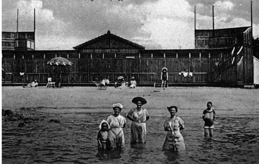
Val Bandon Strandbad Bagni di spiaggia