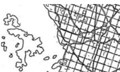
Rimska centurijacija Roman centuriation La cenuriazione romana Römische Centuriation