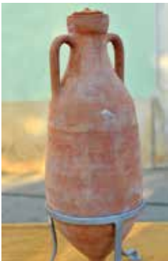
Tvornica amfora u Fažani Amphora production plant in Fažana La fabbrica di anfore a Fasana Amphorenfabrik (Amphorenherstellung) in Fažana

Fažana war wegen seiner natürlichen geographischen Lage, der Nähe des Meeres und der fruchtbaren Felder mit mediterranen Kulturen ein wichtiges wirtschaftliches Zentrum der römischen Zivilisation.