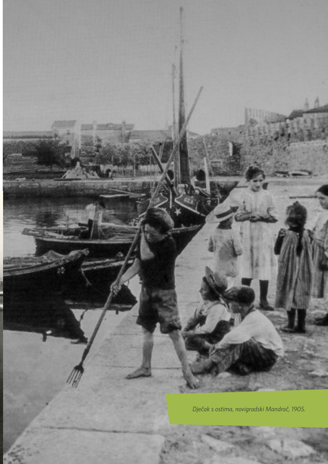
Dječak s ostima, novigradski Mandrač, 1905.