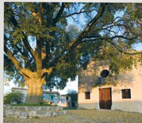
Kloštar je ime dobio po napuštenom samostanu