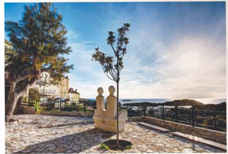
3. Vidikovac Bepo i Tonina