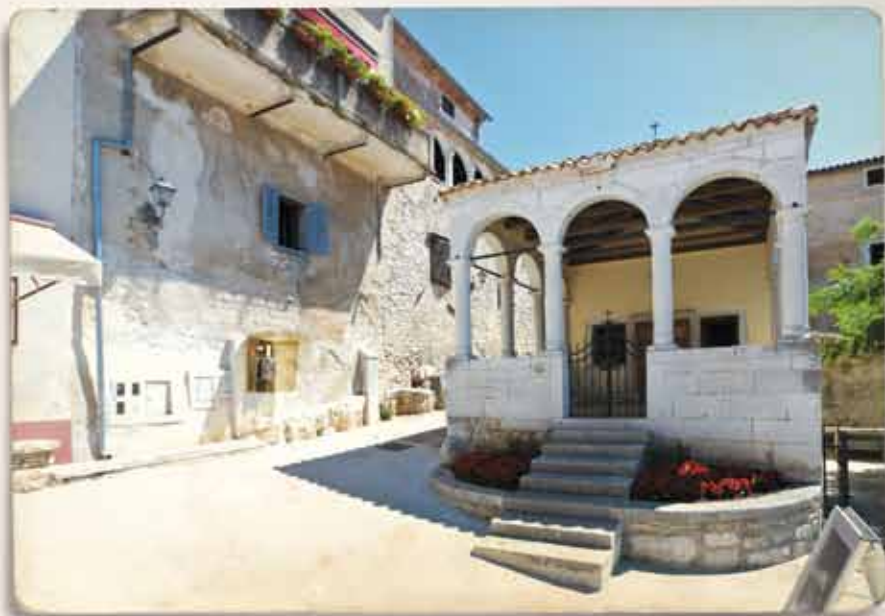
Crkvice svetog Antona, ispred zapadnih gradskih vrata