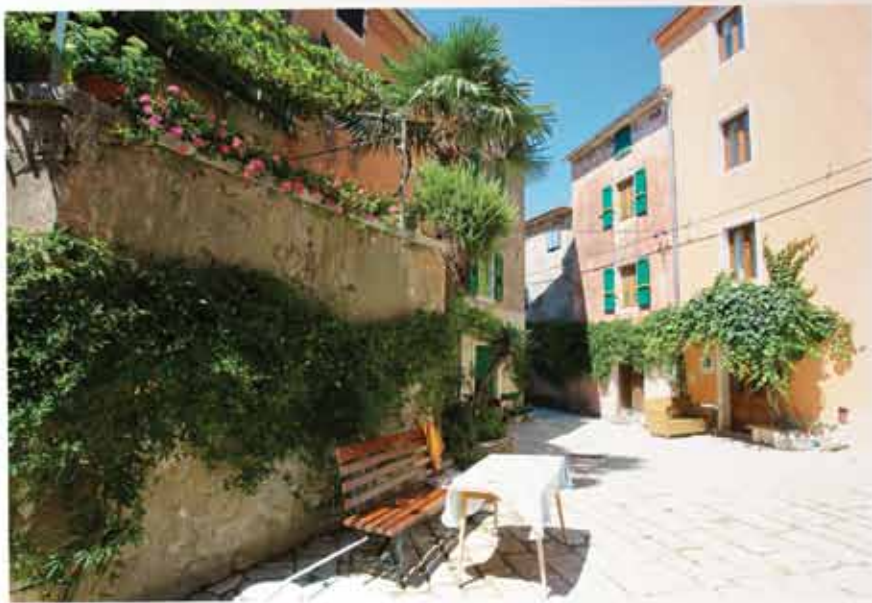
Vrsarske skrivene uličice, terase i horte...