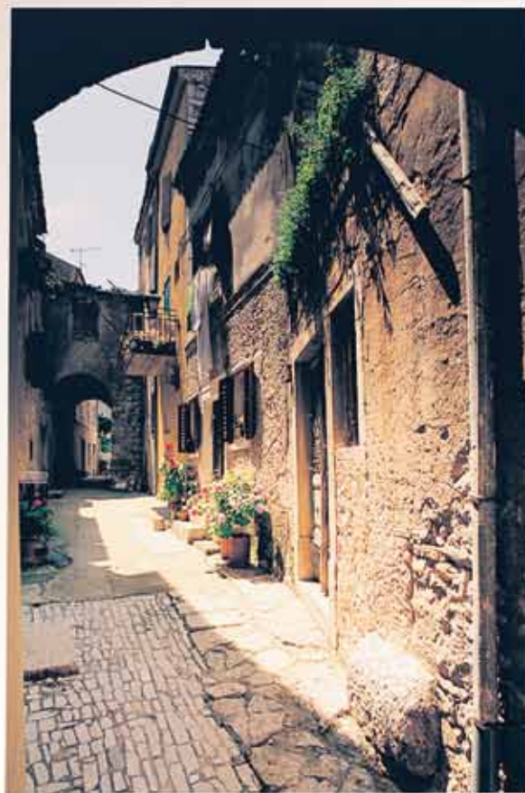
Ulica Pod voltom