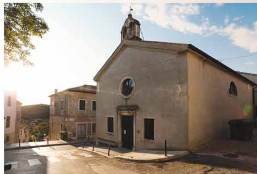
Crkva Sv. Foke iz 17. stoljeća