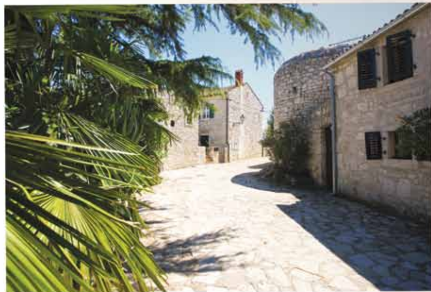
Jedna od gradskih kula, dio srednjovekovnih gradskih zidina