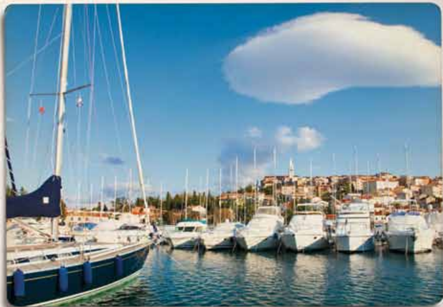
Prirodna zaštićena otokom Sv. Juraj, s 220 vezova u moru i 40 vezova na suhom...