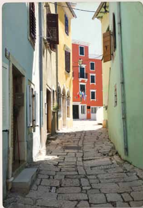
Popločnim putem prema trgu...