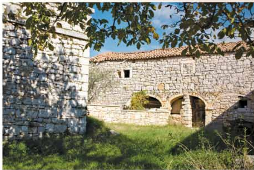
Mir okolnih sela, drugačiji mirisi i okusi