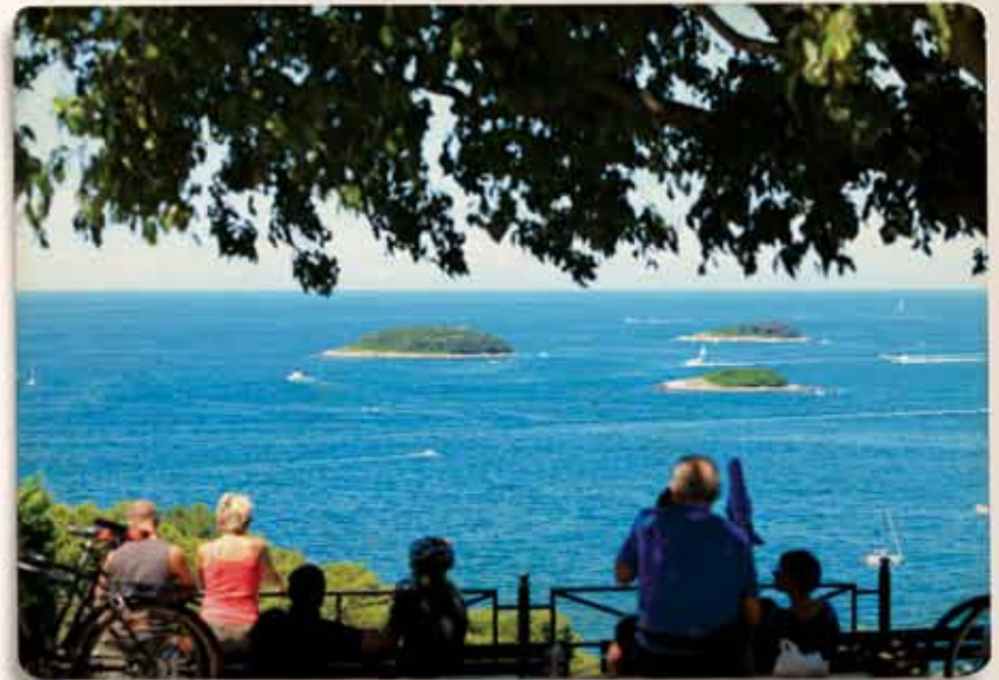
2. Vidikovac iza crkve