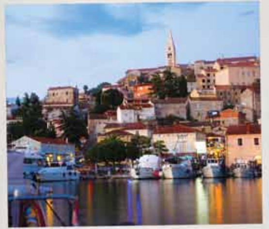
Vrsar, Istra, Hrvatska