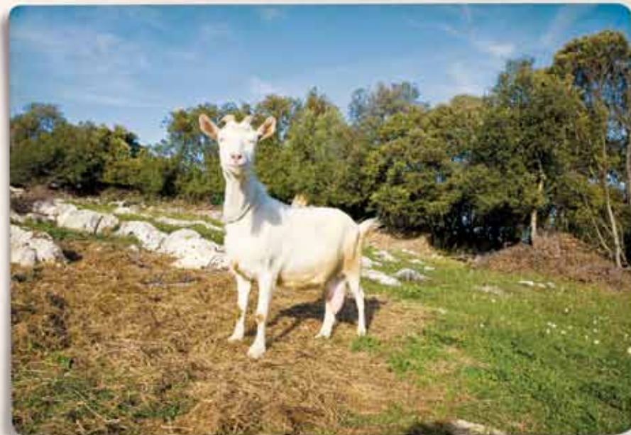
Koza (jarac), povijesni simbol Istre...