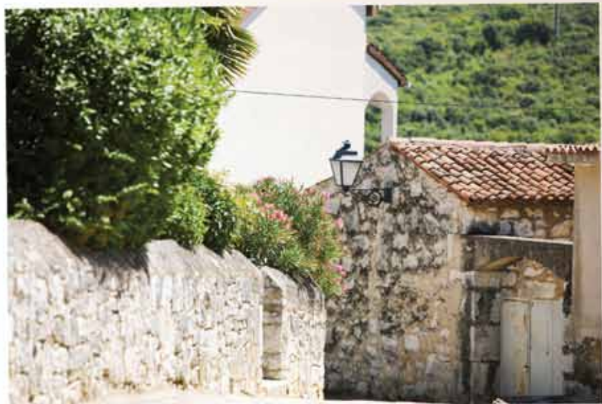
Kameni zidici, prolazi i portuni...