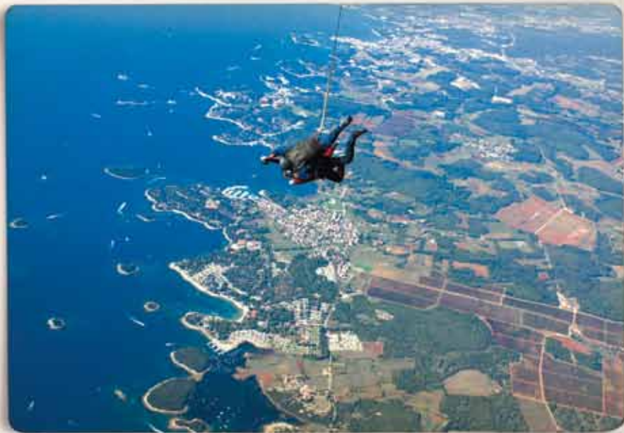
Vrsarški aerodrom, za let iznad Istre... Panoramski shokovi, tandem shokovi, avio piknici, avio izleti, panoramski letovi...